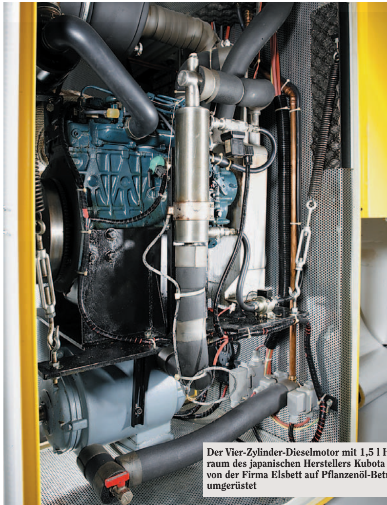
Der Vier-Zylinder-Dieselmotor mit 1,5 l Hubraum des japanischen Herstellers Kubota wurde von der Firma Elsbett auf Pflanzenöl-Betrieb umgerüstet