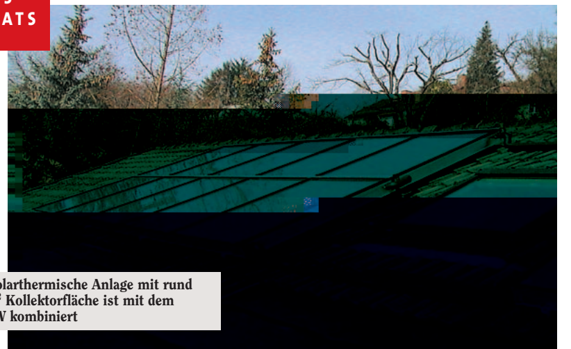
Die solarthermische Anlage mit rund 30 m 2 Kollektorfläche ist mit dem BHKW kombiniert