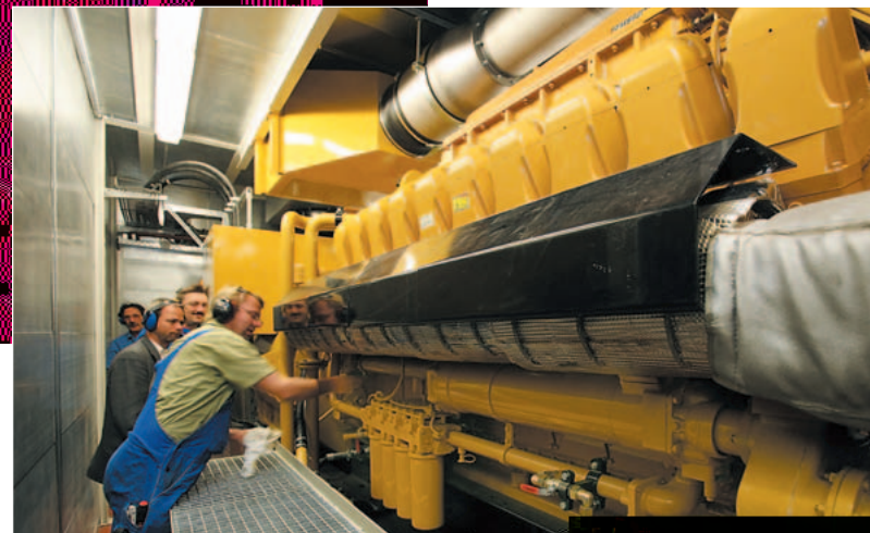
Der größte ökonomische und ökologische Beitrag zur Steigerung der Energieeffizienz im Bremer Airbus-Werk: ein BHKW mit knapp 2 MW el von Zeppelin

dul auf engstem Raum auf der Position des austragierten Erdgas-Kessels während der kontinuierlichen Prozesswärme-Abnahme. „Dies erforderte eine äußerst exakte Ausführungsplanung und ein präzises Projektmanagement, zumal auch der zur Verfügung stehende Aufstellungsraum