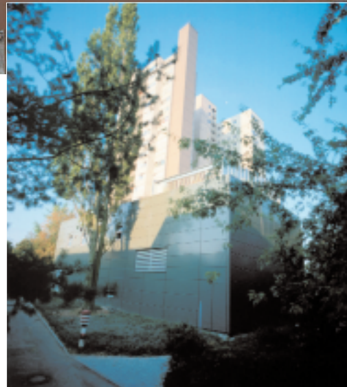
Neues BHKW-Modul steigert den Stromwirkungsgrad auf 41 %

zen werden hingegen das BHKW abgeschaltet und zwischenzeitlich die benötigte Wärme mit Heizöl im Heizwerk erzeugt. Dies wird durch eine übergeordnete Steuerung, in die das BHKW und die Kessel des Heizwerkes integriert sind, gewährleistet.