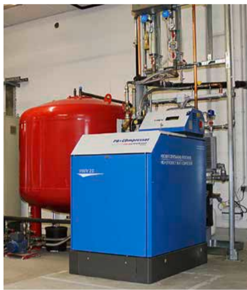
Das Druckluftkraftwerk HWV 20 erzeugt Druckluft und Wärme statt Strom und Wärme

Um die Druckluftproduktion effizienter zu machen, hat Energiewerkstatt ein „BHKW“ mit einem Gasmotor entwickelt, das anstelle des Generators zur Stromproduktion einen Schraubenverdichter hat. Über Wärmetauscher werden außerdem aus dem Abgas des Motors und aus der Abwärme des Kompressors Wärmeströme gewonnen. Aus 100 % Primärenergie des Erdgases entstehen so 10 % Druckluft und 88 % auch auf hohem Temperaturniveau nutzbare Wärmeenergie. Nur 2 % sind nach Angaben der Entwickler Ener-